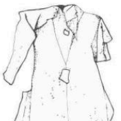
Pohřební roucho svaté Bathildy bylo ušito z jemného bílého lnu s hedvábnou výšivkou kolem výstřihu a na hrudi. Výšivka byla vyvedena v několika odstínech modré, žluté, zelené a červené barvy za použití několika druhů stehů: řetězového, předního a sardového.