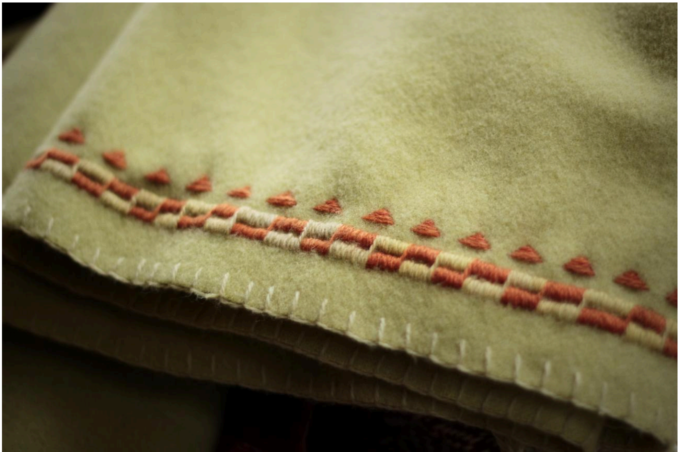
FIG 8. ILLUSTRATION FROM OBLÉKÁNÍ PRAVĚKU (DRESSING PREHISTORY) BY K. URBANOVÁ AND J. T. PULPÁ