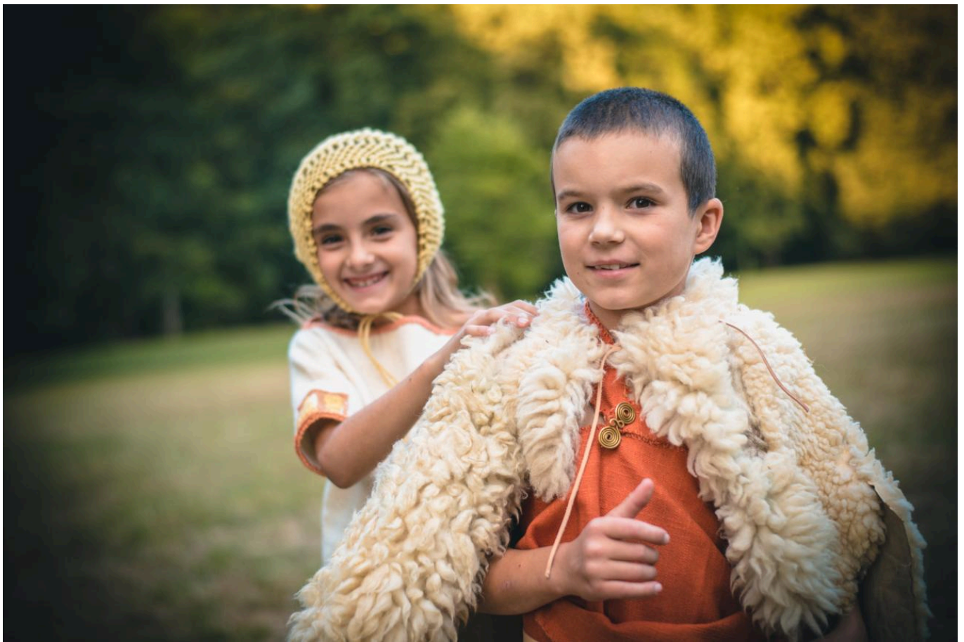
FIG 3. ILLUSTRATION FROM OBLÉKÁNÍ PRAVĚKU (DRESSING PREHISTORY) BY K. URBANOVÁ AND J. T. PULPÁ