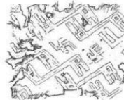
Lodná tkanina , původně rekonstruovaná do tvaru pruhu, utkaná z jemného bílého plátna, zdobená výšivkou , byla obšita s nádsáskou pokládá na závoj světlice, kterým byla ušitá čep. Radiokarbonovou metodou však byla datována kolem roku 1024, je tedy mladší. Výšivka lánou plši zobrazovala svastiky a pravouhlé zalomené linie v podélných páscech a okraje byly temově žlutými proužky. Pásové látky je nejdí – mohla být vyrobena jak v Čechách, tak dovezena.

Rukávy samotné byly poměrně dlouhé, soudí se, že byly shrnuty a možná přidržovány na zápěstí pomocí náramků. Zajímavým prvkem byl výstřih, který se táhl jako linie přes celou přední stranu až do poloviny zad. V přední části byl na hrudi vložen a všit trojúhelník z odstřížku a obdélník podél výstřihu, tvořící jakýsi „kolár“ kolem krku. Je otázkou, zda se jednalo původně o oděv čistě funerální, tudíž královnu nenošený a existují dokonce i spekulace o tom, že původně nebyl určen pro Bathildu. Žádný podobný kus tohoto střihu se nám z tak davné minulosti bohužel nedochoval, a tudíž nemáme možnost porovnání ... Zaručené pohřebním hávem byl svrchní kus látky, prostřížený a zdobený kolem krku a na hrudi jemnou výšivkou hedvábnými nitěmi imitující náhrdelník se zavěšeným křížem na hrudi. Posledním kusem oděvu zemřel královny byl púlkruhový plášť červené barvy se žlutými útkovými nitěmi tvořícími ozdobné střípce.