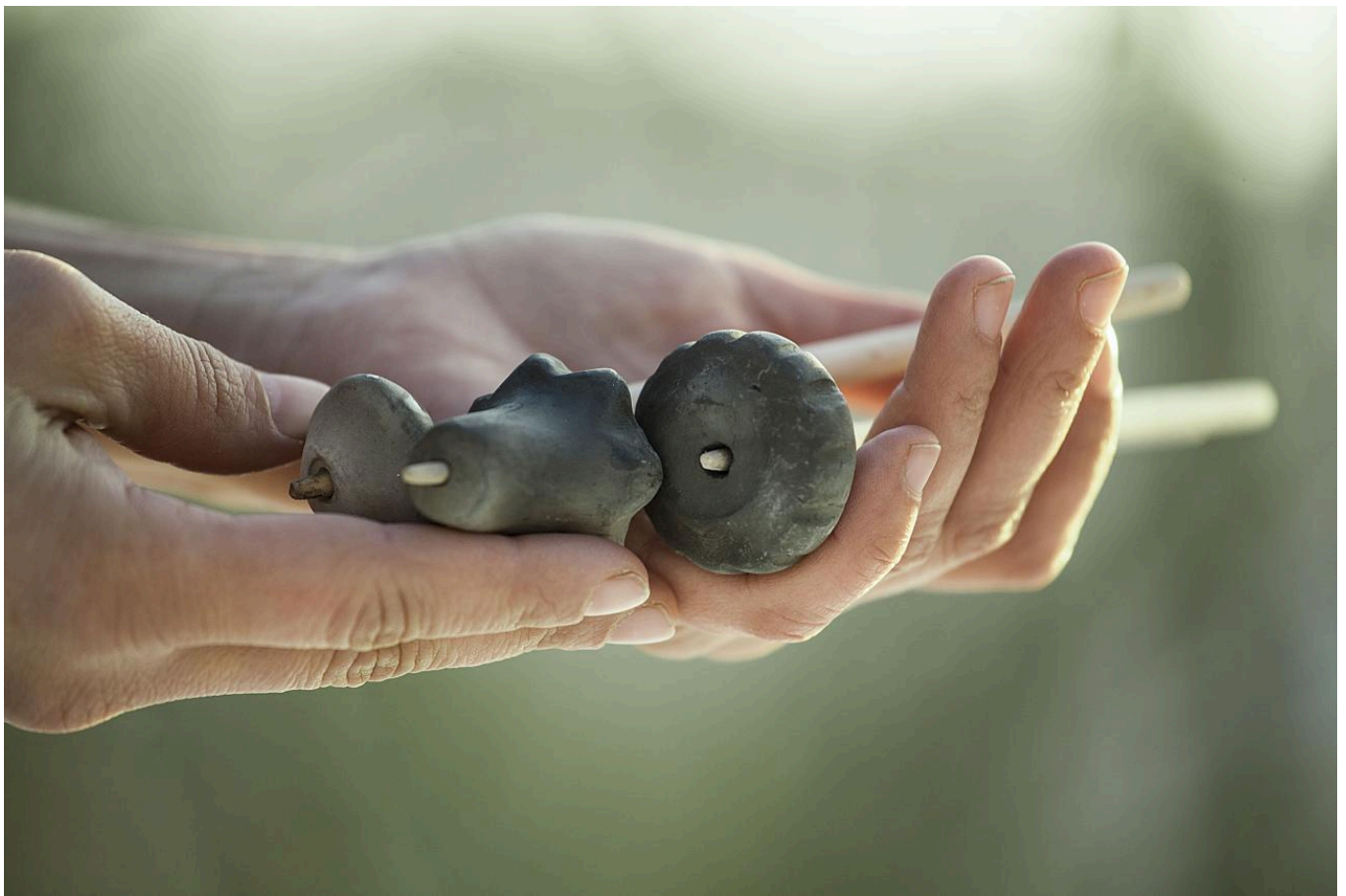
FIG 7. ILLUSTRATION FROM OBLÉKÁNÍ PRAVĚKU (DRESSING PREHISTORY) BY K. URBANOVÁ AND J. T. PULPÁ