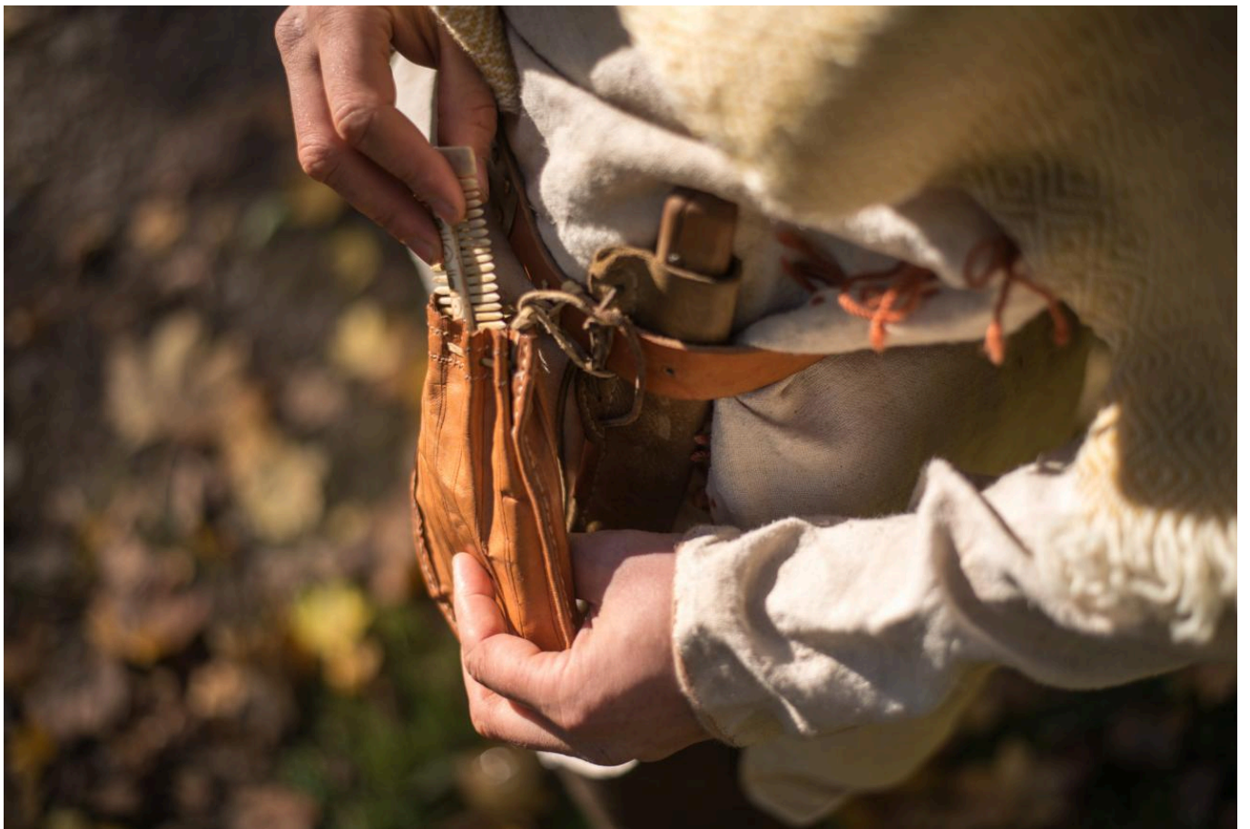
FIG 1. ILLUSTRATION FROM OBLÉKÁNÍ PRAVĚKU (DRESSING PREHISTORY) BY K. URBANOVÁ AND J. T. PULPÁN