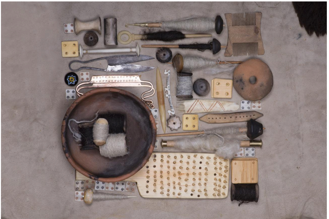
FIG 5. ILLUSTRATION FROM OBLÉKÁNÍ PRAVĚKU (DRESSING PREHISTORY) BY K. URBANOVÁ AND J. T. PULPÁ