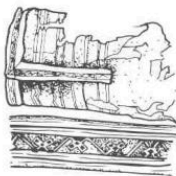
Tkanice , zhotovená na destičkovém stávků, která byla přitlačena na rukávech pohřebního oděvu svaté Bertilly , měla složitý geometrický dekór.