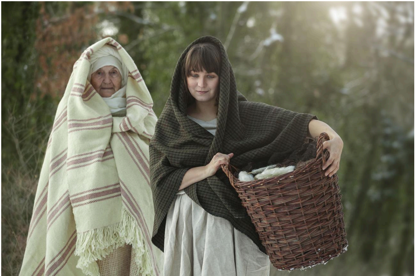
FIG 6. ILLUSTRATION FROM OBLÉKÁNÍ PRAVĚKU (DRESSING PREHISTORY) BY K. URBANOVÁ AND J. T. PULPÁ