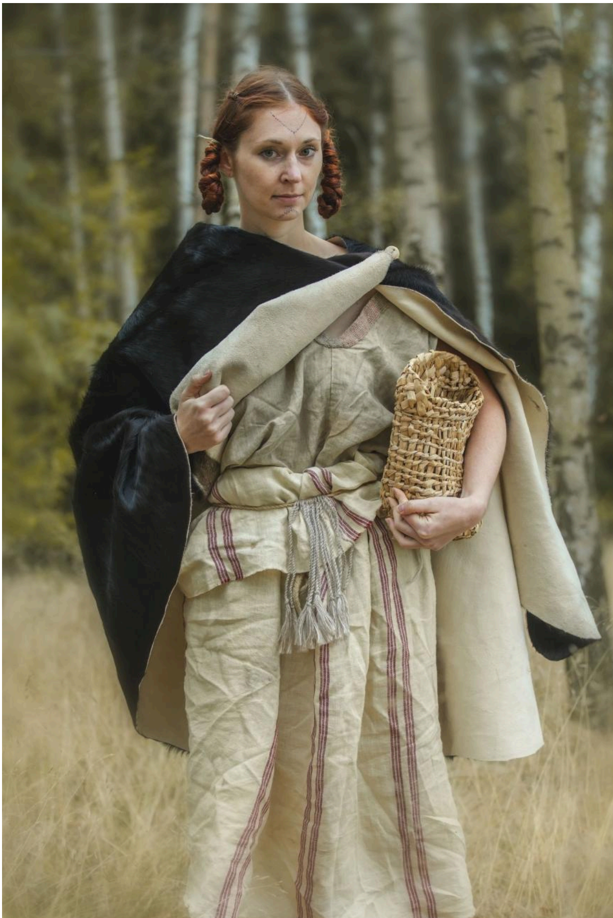
FIG 2. ILLUSTRATION FROM OBLÉKÁNÍ PRAVĚKU (DRESSING PREHISTORY) BY K. URBANOVÁ AND J. T. PULPÁ