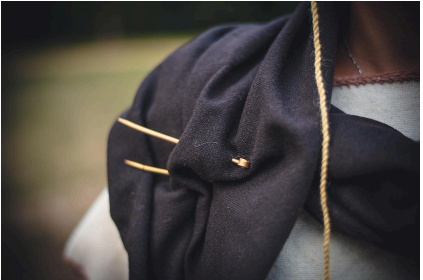
FIG 4. ILLUSTRATION FROM OBLÉKÁNÍ PRAVĚKU (DRESSING PREHISTORY) BY K. URBANOVÁ AND J. T. PULPÁ