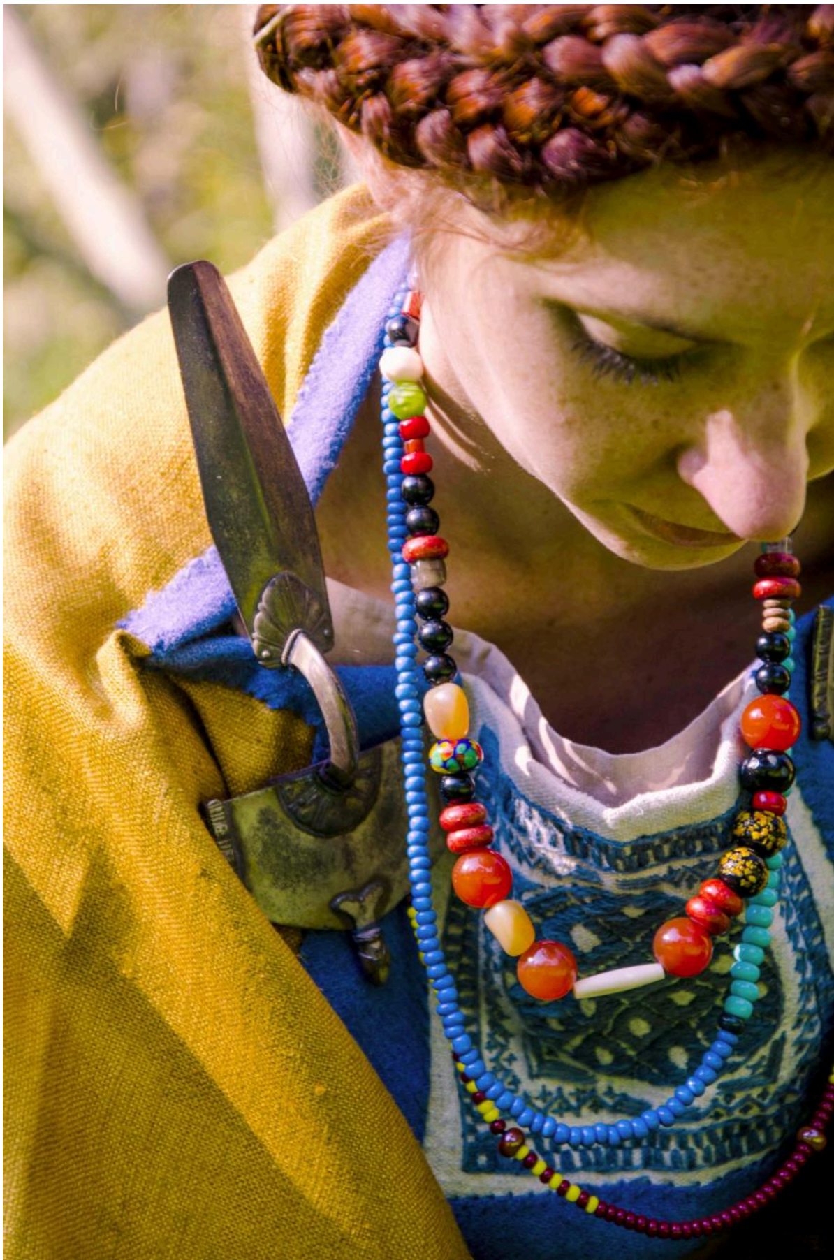
FIG 9. ILLUSTRATION FROM OBLÉKÁNÍ PRAVĚKU (DRESSING PREHISTORY) BY K. URBANOVÁ AND J. T. PULPÁ